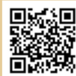
申込専用フォーム

〒590-0078 堺市堺区南瓦町2-1 堺市総合福祉会館2階 堺市民活動センター内 一般社団法人いきいき堺市民大学 TEL/FAX : 072-232-0029 メール : ss-daigaku@s.zaq.jp