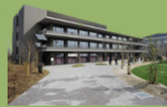
関西大学 堺キャンパス

さまざまな分野で働く世代、子育て・介護を終えた世代、そして元気なシニア世代など、それぞれの人たちが目指す「次のステージ」「新たな挑戦」を「セカンドステージ」と捉え、新たな学びや生き方のヒントになるような気づきの場を提供します。