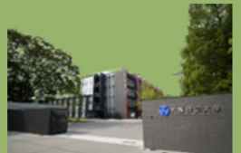
大阪公立大学 中百舌鳥キャンパス